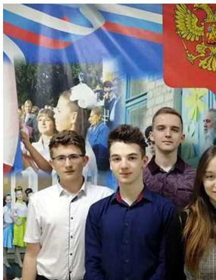
Акция "Весенняя неделя добра"

Под девизом "Мы вместе создаем наше будущее!", волонтеры антинаркотического отряда « Горящие сердца » и отряд « Волонтеры Победы » МОУ «Новохопёрская гимназия №1» объединились для участия в ежегодной общероссийской добровольческой акции " Весенняя неделя добра ". В преддверии великого праздника всех поколений Дня победы, ребята благоустраивали мемориал « Парк Победы ».